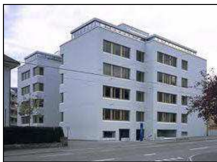
Kursort: Zentrum für Weiterbildung der UZH Schaffhauserstrasse 228, 8057 Zürich