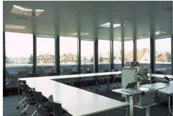
Zentrum für Weiterbildung Seminarraum K12

gewöhnlich auf einer individuell geprägten Alltagspsychologie, die wir über Jahre für unsere Bedürfnisse entwickelt haben – und deren wir uns selten bewusst sind. Diese Alltagspsychologie beeinflusst in hohem Masse unser Kommunikationsverhalten und muss dort, wo sie sich als unzulänglich erweist, durch wissenschaftlich gesicherte Erkenntnisse der Psychologie ersetzt werden.