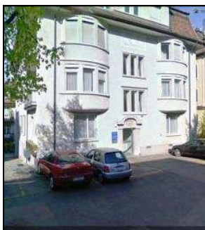
Sitz ipsyt GmbH Scheuchzerstrasse 21, 8006 Zürich